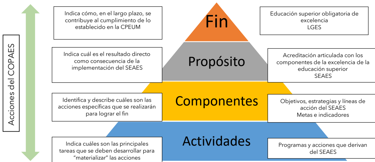
Figura 2. Articulación de las acciones del COPAES con el SEAES

El COPAES, para contribuir al cumplimiento de lo establecido en el nuevo escenario de la acreditación de la educación superior, diseñará e implementará 12 acciones articuladas con los fines que mandata el SEAES en dos direcciones: a) intrínseca , para fortalecer, desarrollar y consolidar las capacidades institucionales del COPAES con la intención de responder a los desafíos que demanda el SEAES, y b) extrínseca , para que el COPAES incida positivamente en la consecución del fin que plantea el SEAES (ver figura 2).